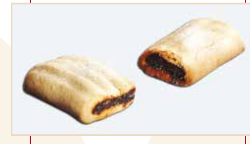
15. Frollino stampato a rullo, ripieno prugna