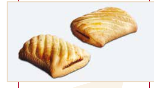
14. Frolla stampata a rullo, ripieno fichi