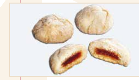
20. Amaretto ripieno