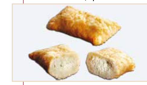
23. Tronchetto salato, ripieno