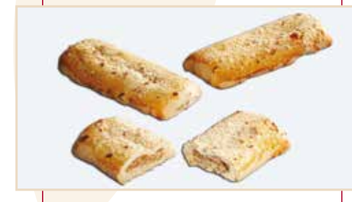
22. Barretta nocciole, taglio a ghigliottina