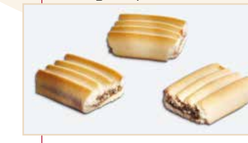
8. Frolla rigata ripieno datteri