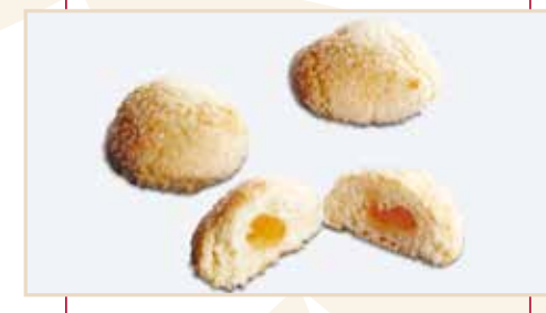
18. Biscotto pasta di mandorle ripiena