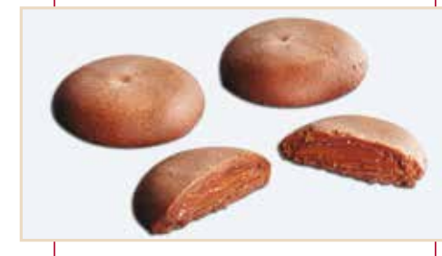
21. Frollino cioccolato, ripieno nutella