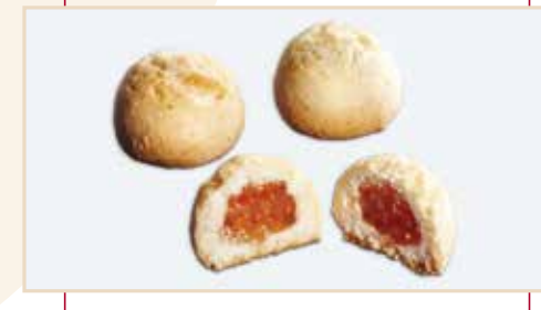
16. Frollino ripieno marmellata