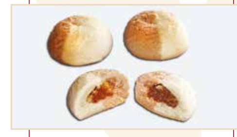
17. Frollino bicolore, ripieno marmellata