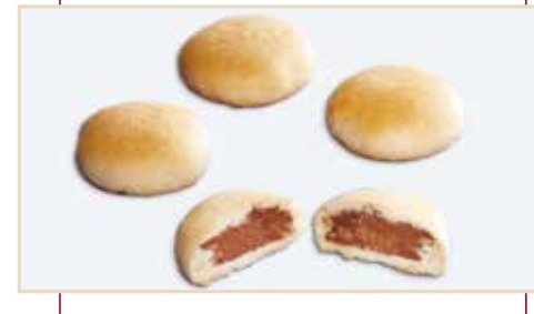
13. Frollino ripieno nutella