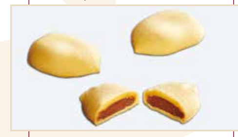
19. Goccia, ripiena cioccolato