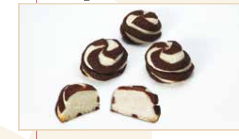
7. Roll taglio a diaframma